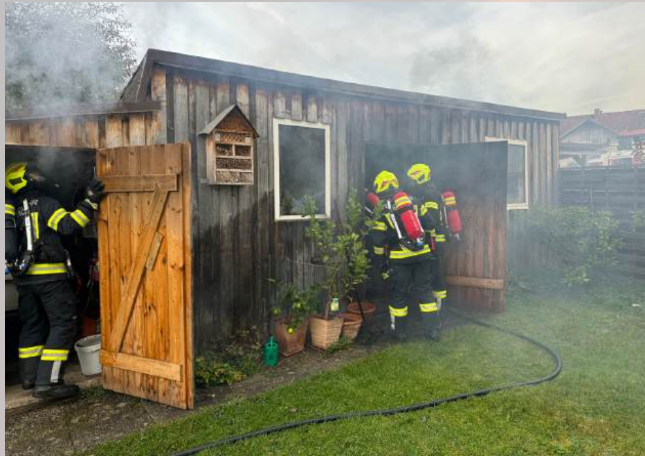
Brand eines Schuppens, am 25. Oktober 2024