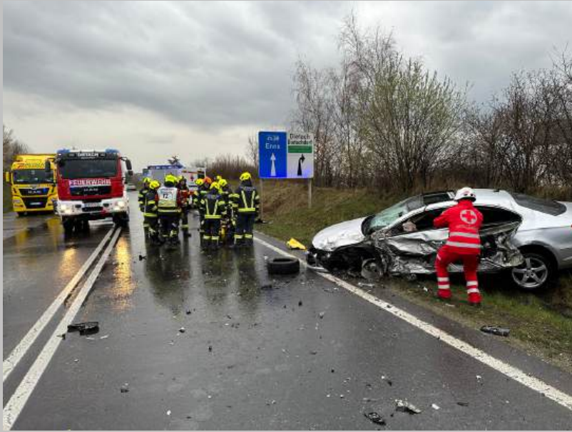
Verkehrsunfall auf der B309, am 12. Februar 2024