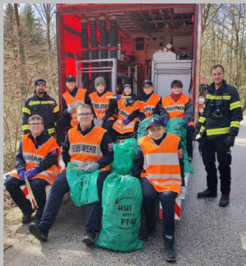
Flurreinigungsaktion „Hui statt Pfui“