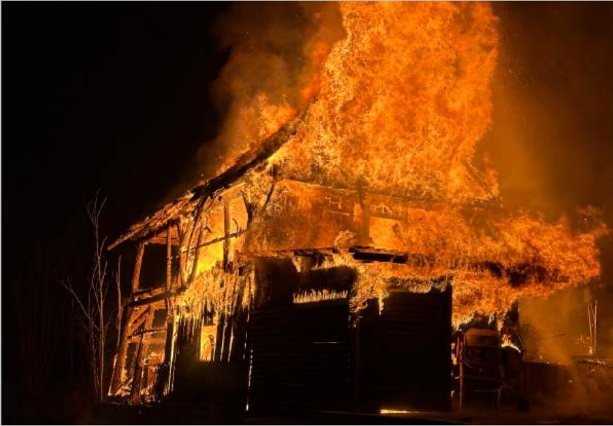
Brand in der Asangstraße, am 11. Jänner 2024