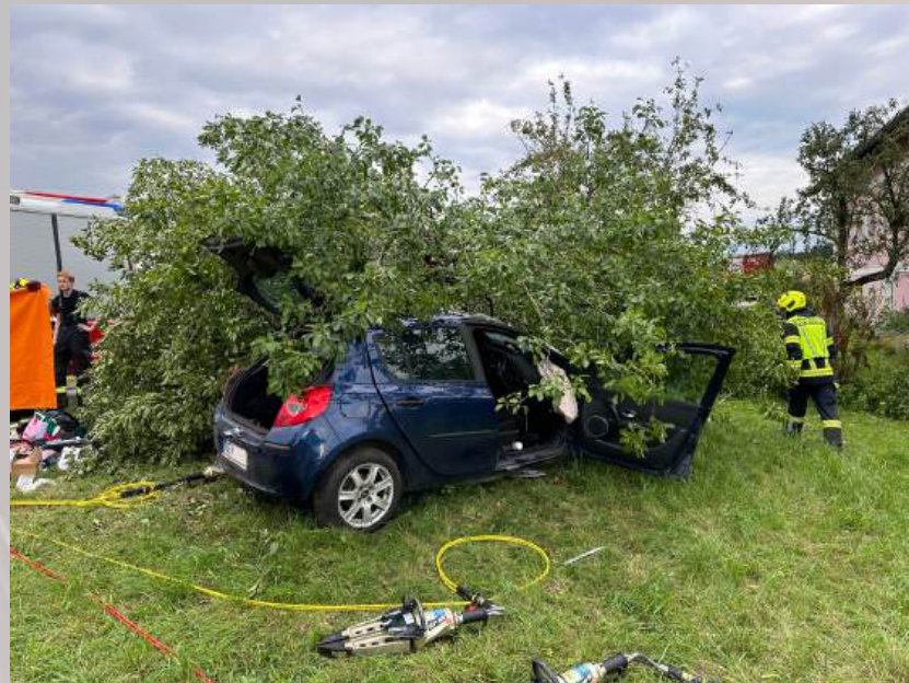
Verkehrsunfall in der Thannstraße, am 02. Juli 2024

Mehr Infos zu den Einsätzen finden Sie unter feuerwehr-dietach.com oder scannen Sie den QR-Code.