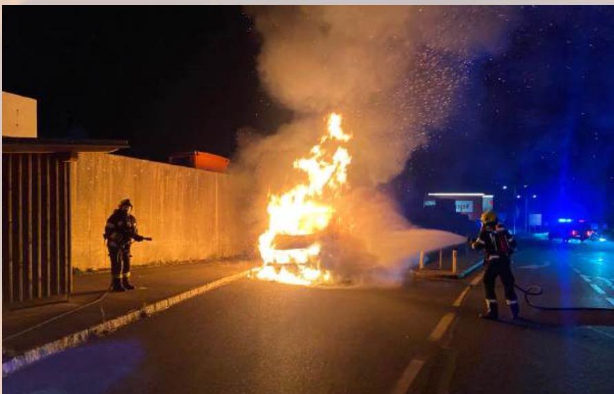
Brand eines Kleinbusses, am 20. Oktober 2024